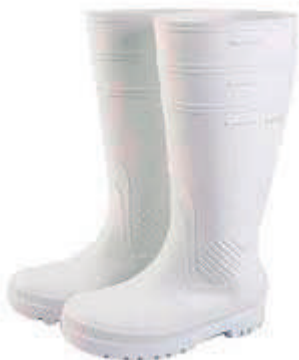
BOTA PVC S5 CON PUNTERA Y PLANTILLA METÁLICA COSMO