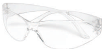
LENTE REDONDO TRANSPARENTE