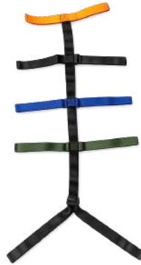
CORREA TIPO ARAÑA PARA CAMILLA