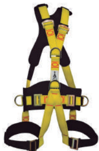
ARNÉS SEGURIDAD 5 ARGOLLAS