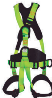
ARNÉS DIELECTRICO 5 ARGOLLAS CON FAJA LUMBAR