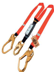
LÍNEA DE VIDA TUBULAR DOBLE GANCHO