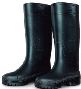
BOTA PVC S5 CON PUNTERA Y PLANTILLA METÁLICA SIN PUNTERA