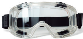
LENTE GOGGLE SOLDADOR POLICARBONATO