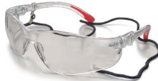
LENTE SEGURIDAD TRANSPARENTE CON CORDÓN