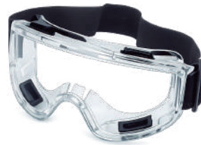
LENTE GOGGLE ANTIEMPAÑO COSMO