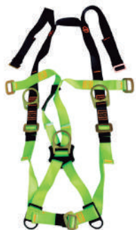
ARNÉS SEGURIDAD 3 ARGOLLAS